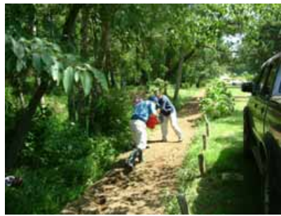
球根をランダムに置いていきます。